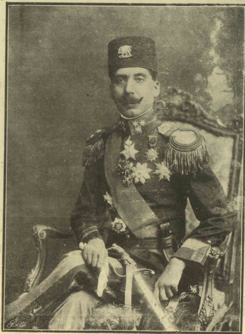
آقای میرزا فتح الله خان طباطبائی پاك روان کفیل وزیر امور خارجه ایران (امیر ارفع ساق)

اینک؛ و جب انتشارات رسمی حراثد مصر ۱۰۰ - هده مزبور در تاریخ ۲۸ ماه نوامبر ۱۹۲۸ در طهران بواسطه جناب حسن نشأت یاشا بمو جب تعلیمات دکتور حافظ یقینی بک وزیر فعال امور خارجه مصري از طرف مصر و آقای پاك روان کفیل امور خارجه از طرف ایران بامضا رسیده است . بر اثر این خبر هر يك از جرائد مصري مقاله های اساسی خود را به موضوع فوق اختصاص داده و احساسات شرف انگیز فوق للتصوری در نتیجه و فقیهت وزیر امور خارجه مصر و نماینده مصري در ایران بامضای این قرار داد، ابراز داشته اند، زیرا این اولین مرتبه ایست که دیده می شود حکومتی از حقوق ممتاز اتباع خود در مصر تنازل نماید، بلکه بالمیکس هر يك از حکومت سعي و جدیت دارند که امتیازات اتباع خود را در مصر بر