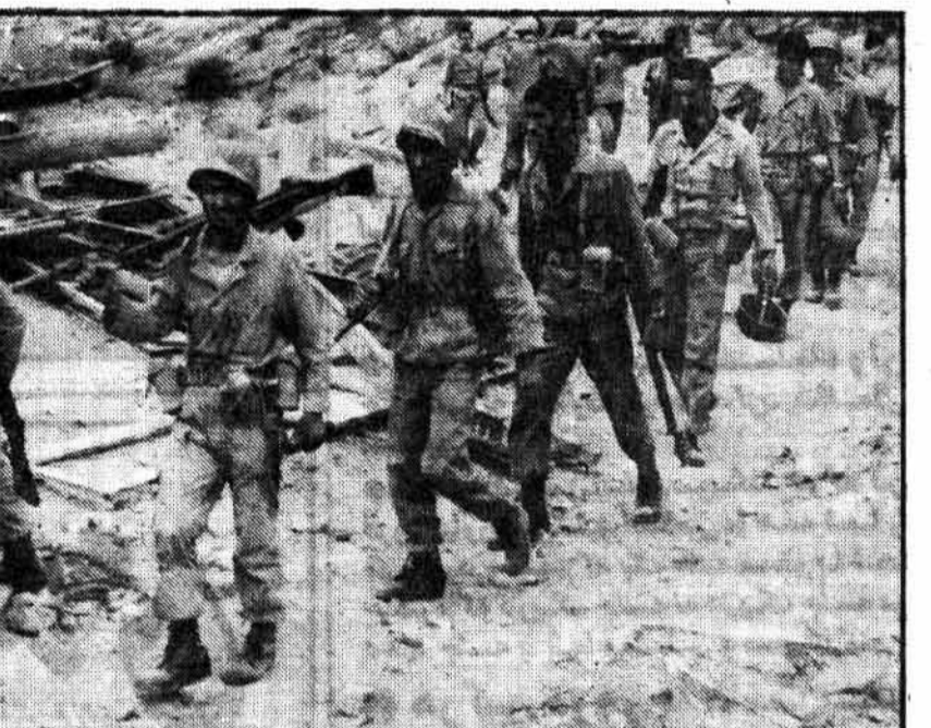
اطلاعیه شماره ۴۹۹ ستاد مشترک ارتش جمهوری اسلامی ایران

چرا مجاهدین خلق بجای باطل واژه... در جریان عملیات نهر فرات، مجاهدین خلق با دشمنان مبارزه کردند. در جریان عملیات نهر فرات، مجاهدین خلق با دشمنان مبارزه کردند.